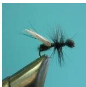
Ant dry black and red Hook size 16 - 20