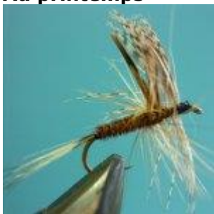
March Brown dry Hook size 12 - 16