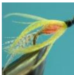
Mayflywet, Preska Hook size 12 - 16