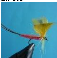
Mayfly dry, color yellow and orange, Hook size 10 - 14