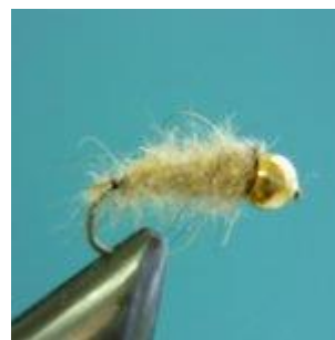
Goldnymph color brown and beige Hook size 14 - 16