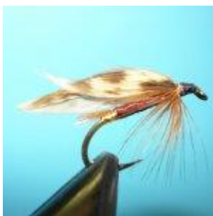
March Brown wet Hook size 10 - 14