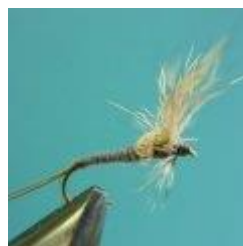
Caddisfly dry Hook size 14 - 18