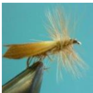
Sedgefly dry tan Hook size 12 - 16