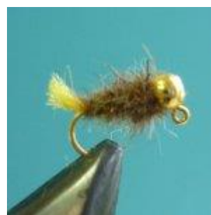
Goldnymph color brown, beige or grey Hook size 16 - 20